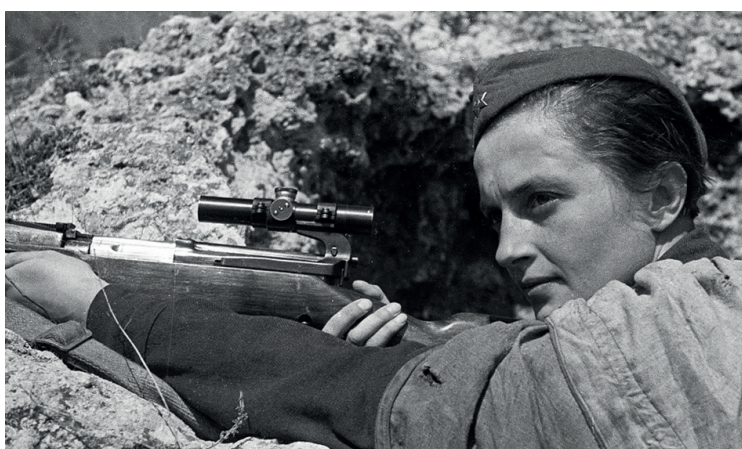
Людмила Павличенко с винтовкой в окопе, 1942 год